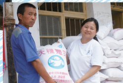
青海玉樹地震派發賑災物資前攝影