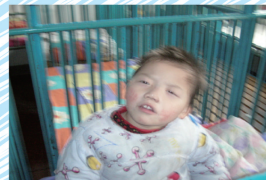
每日6元助養國內殘疾孤兒