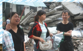
鄔牧師在四川地震災區安慰災民