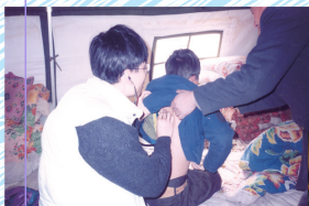
幫助貧困地區醫療服務