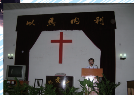
內地教會差傳講道