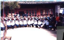
少數民族的福音工作