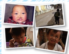
殘疾孤兒極需要大家援助