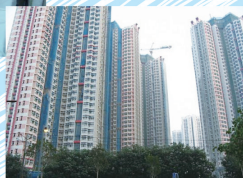
陽光下的天水圍-天水圍社區支援服務