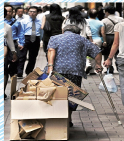
社區獨居老人支援