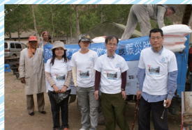
親自派大米給災民