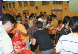
在水圍派米及禮物包